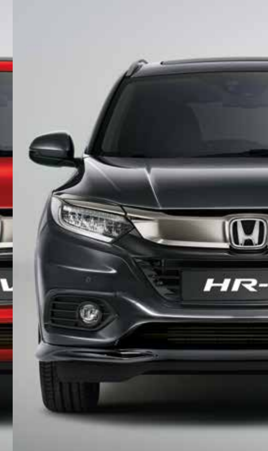
MODERN STEEL METALLIC