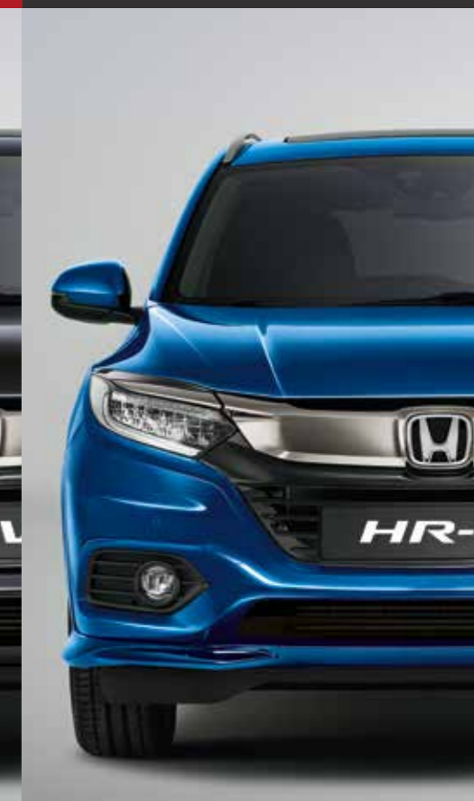
BRILLIANT SPORTY BLUE METALLIC