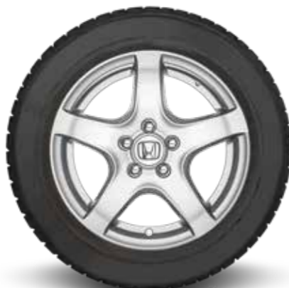
16-TUMS COMET 16 X 7J