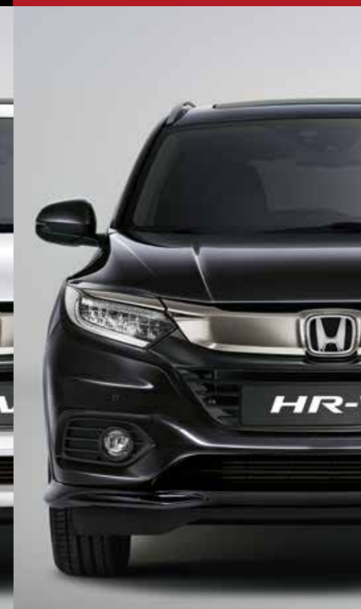
RUSE BLACK METALLIC