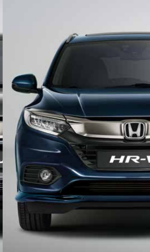
MIDNIGHT BLUE BEAM METALLIC