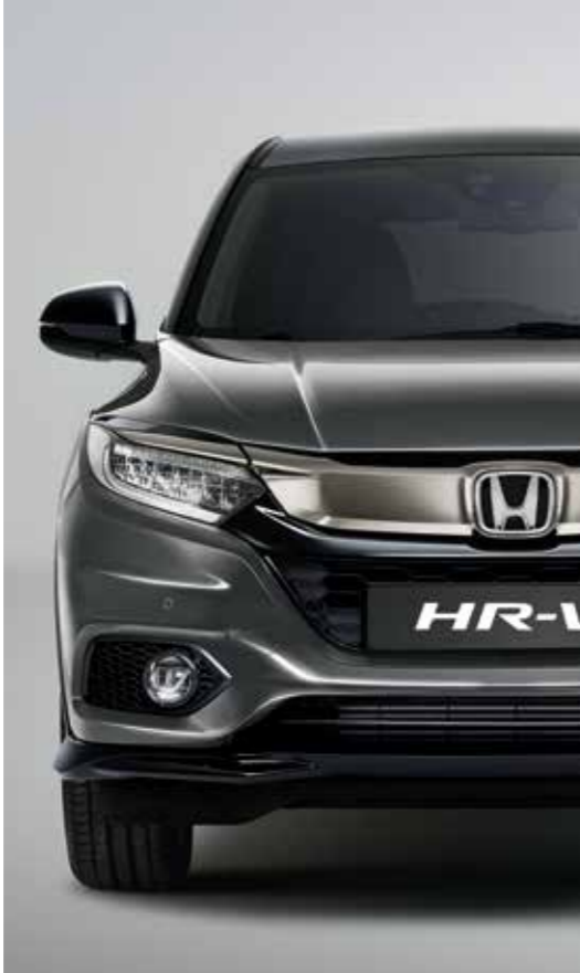
PLATINUM GREY METALLIC